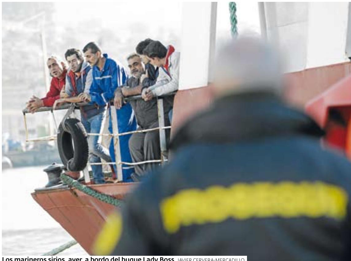
Los marineros sirios, ayer, a bordo del buque Lady Boss.

Los marineros afirman ser fugitivos porque se negaron a unirse al Ejército sirio para participar en la guerra. Aseguran estar «amenazados de muerte» si regresan a su país y sostienen que las represalias serían «terribles». >2 a 4