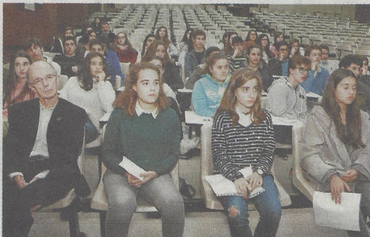
Estudiantes y profesores, ayer, en la videoconferencia. BEATRIZ CÍSCAR