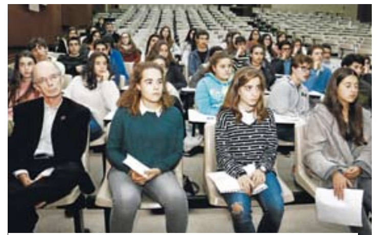
Estudiantes y profesores, ayer, en la videoconferencia. BEATRIZ CÍSCAR

► Los dueños de locales en el casco histórico instalan verjas y candados contra los ladrones >10